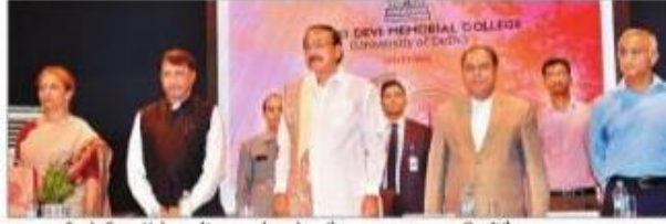
जानकी देवी कॉलेज में समारोह के दौरान उपराष्ट्रपति वेंकैया नायडू व अन्य।