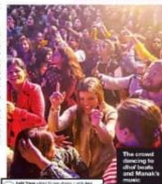
The crowd dancing to Jass Manak's music