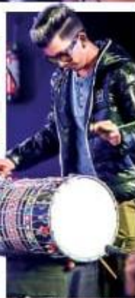
DESI DHOOL FOR THE CROWD