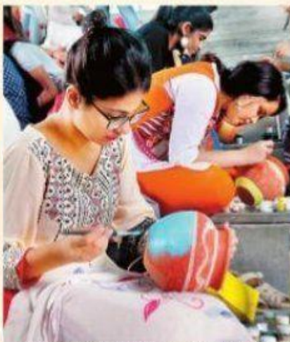
जानकी देवी मेमोरियल कॉलेज में दिवाली मेले के दौरान छात्राएं।