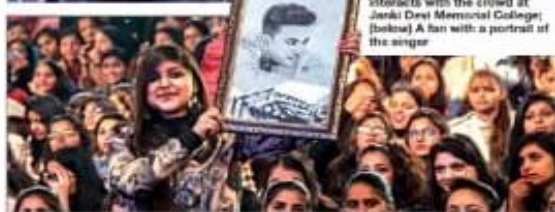
LOVE YOU GUYS: Jass Manak interacts with the crowd at Jass Manak Memorial College; (below) A fan with a portrait of the singer